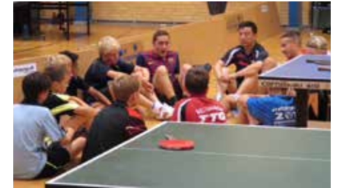
Nach jeder Trainingseinheit wurden Feed-Back-Gespräche geführt.

Gesagt, getan: Am 27.06.14 versammelten sich Spieler und Trainer bei uns im Garten. Noch kurz vorher sah es so aus, als würde uns das Wetter einen Strich durch die Rechnung machen.