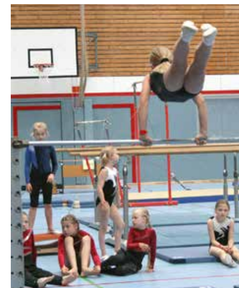
Turnerinnen des RTV

Am Sonntag war nach dem Frühstück Packen angesagt, denn um 10.00 Uhr begannen die Staffelläufe, die wir wetterbedingt in die Halle verlegen mussten, sowie auch die Siegerehrung. Die Staffelläufe gewann die Mannschaft vom Rellinger Turnverein.